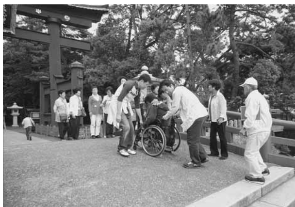
ふれあいバスツアーでの様子