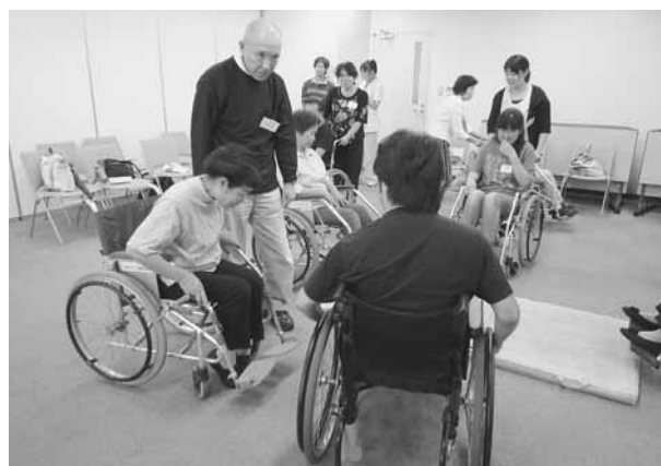
車いすガイドヘルプボランティア養成講座での様子

ボランティアに関するお問合せがありましたら、ボランティアセンター（一宮市社会福祉協議会内）までお気軽にご相談下さい。