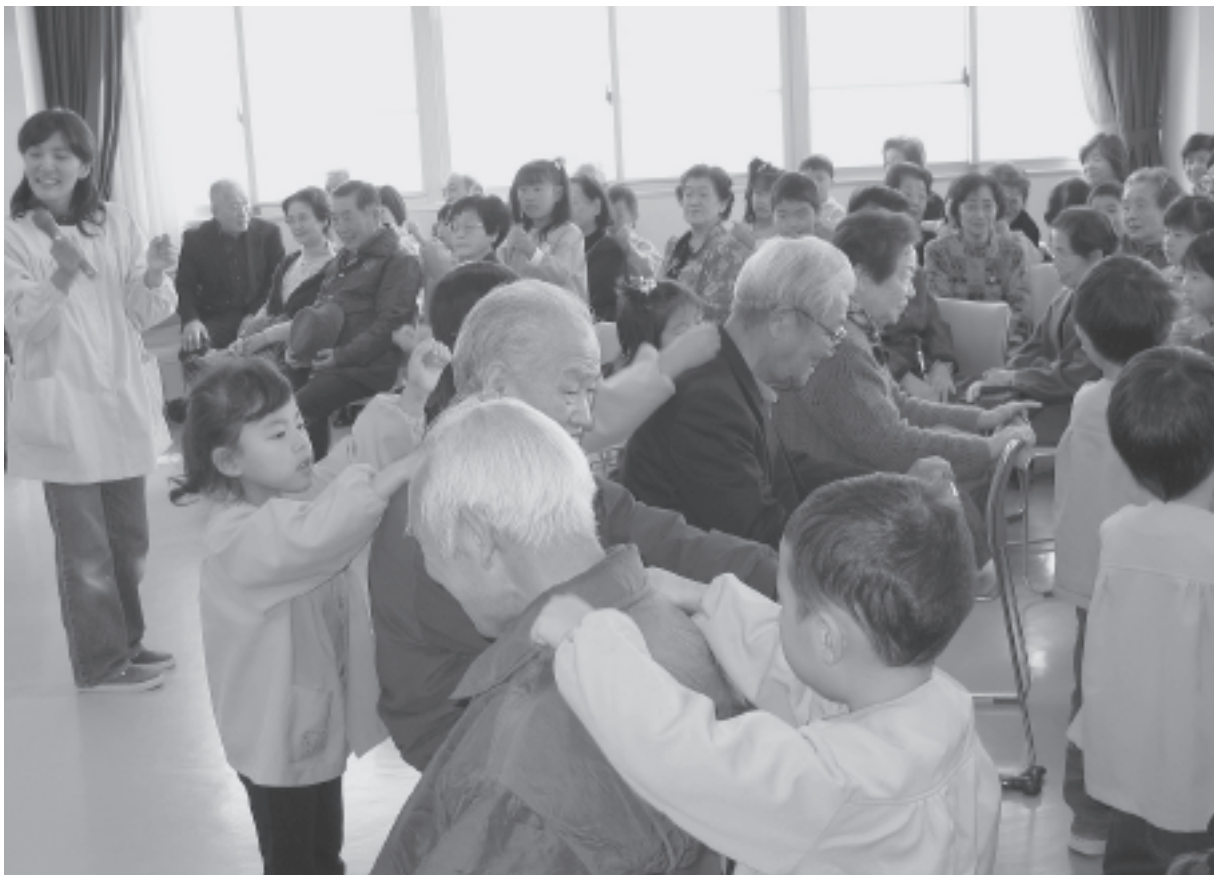
大志ふれあい教室