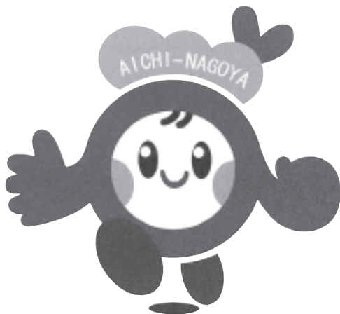
マスコットキャラクター