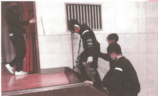
【福祉実践教室（高齢者疑似体験）】