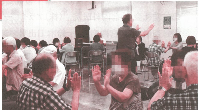
【ふれあい・いきいきサロン交流会】