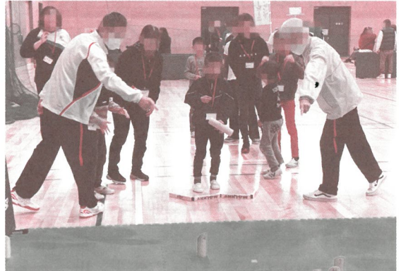
【ユニバーサルスポーツ体験交流会】

皆様からお寄せいただいた寄付金は、一宮市を良くする活動に約80% 29,264,496円、愛知県内の広域の社会福祉施設の整備や団体の事業等に約20% 7,091,000円が役立てられます。