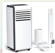
スポットクーラー