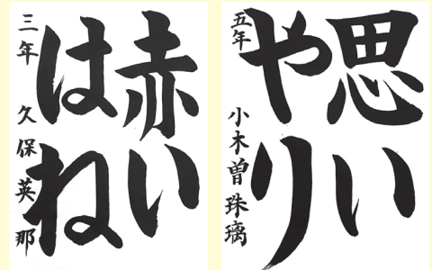
久保 英那 (奥小3年)