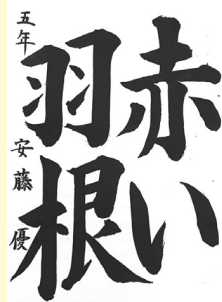
安藤 優 (奥小5年)