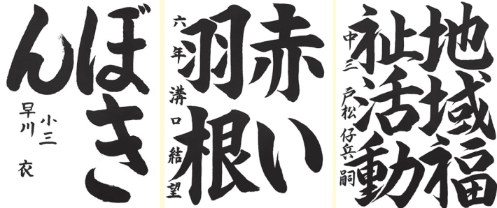
早川 衣 (大和東小3年)