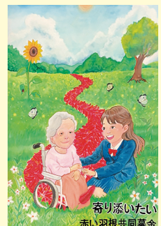
松原 朱音 (南部中3年)