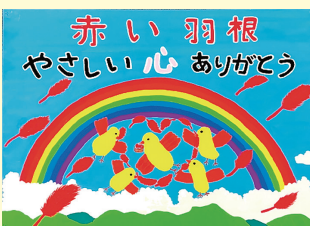
田中 瑠偉 (北方小5年)