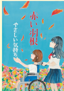
村上 歩乃花 (木曾川中2年)