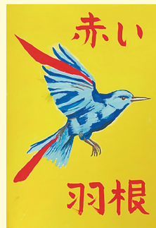
早川 衣 (大和東小3年)