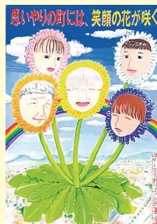
平 証子 (西成中1年)