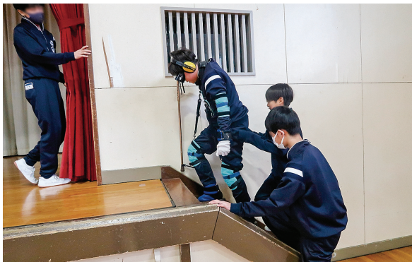
【福祉実践教室(高齢者疑似体験)】