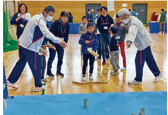
【ユニバーサルスポーツ体験交流会】

皆さまからお寄せいただいた寄付金は、一宮市を良くする活動に 約80% 29,264,496円 、愛知県内の広域の社会福祉施設の整備や団体の事業等に 約20% 7,091,000円 が役立てられます。