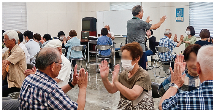
【ふれあい・いきいきサロン交流会】