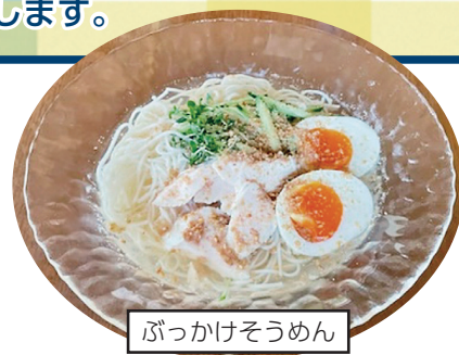
ぶっかけそうめん