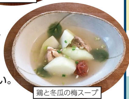
鶏と冬瓜の梅スープ