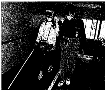
ガイドヘルプ体験