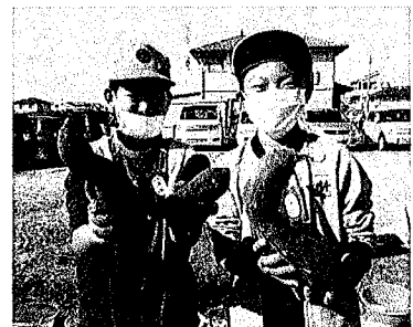
さつまいもの収穫