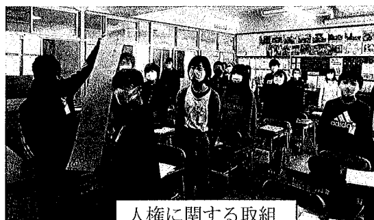
人権に関する取組

12月には、児童会と代表委員会が全校放送で発信したり、各学級で、普段使っている言葉遣いについて見つめ直したりした。これらの活動を通して、相手を思いやる行動の大切さについて考えを深めることができた。