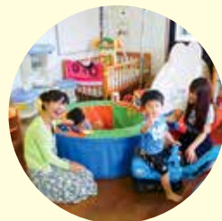
みんないい笑顔です