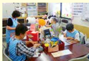
プレゼントおもちゃ作成の様子