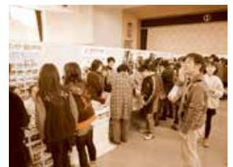
昨年度のブース出展の様子

今年は津島市で開催予定となっています。詳細については 14 ページをご覧ください。