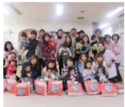
クリスマス施設訪問