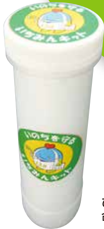
ひとり暮らし高齢者歳末訪問 命を守る「いちみんキット」を配付