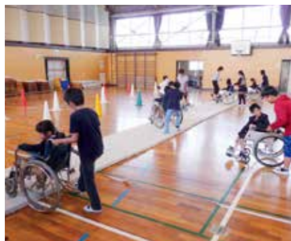
小中学校福祉実践教室開催