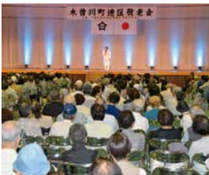
敬老の日行事助成