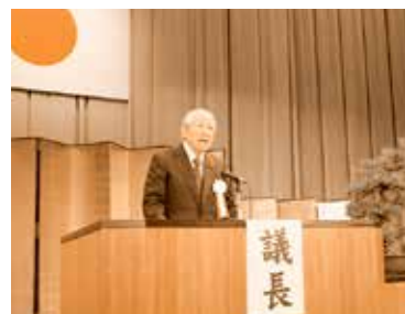
第63回愛知県社会福祉大会の様子