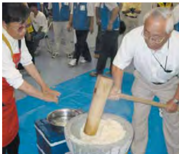
ふれあい餅つき大会