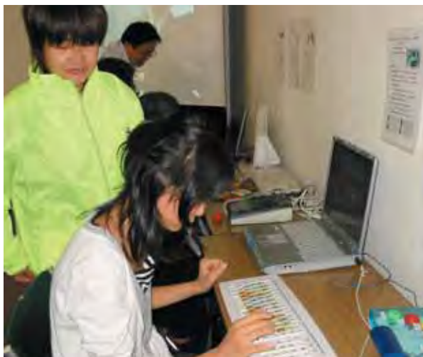
聴覚パソコン体験コーナー